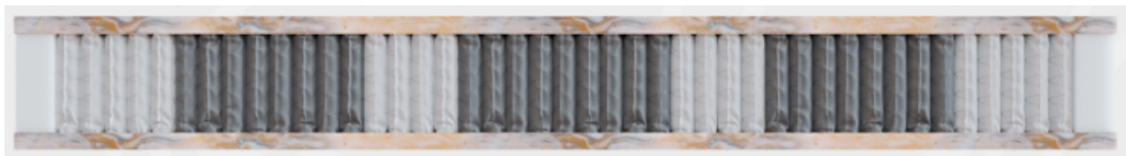
7-Zonen Matratze mit unterschiedlichen Federstärken. 250 Federn m2